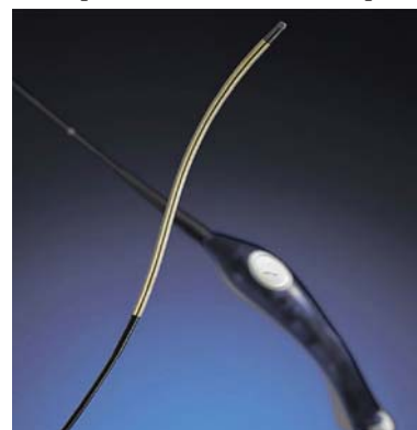
Рис. 3. Катетер VNUS Closure FAST для эндовазальной радиочастотной облитерации вен

В России на сегодняшний день для эндовазальной радиочастотной облитерации вен применяется патентованная технология VNUS Closure компании «Covidien». Первая генерация